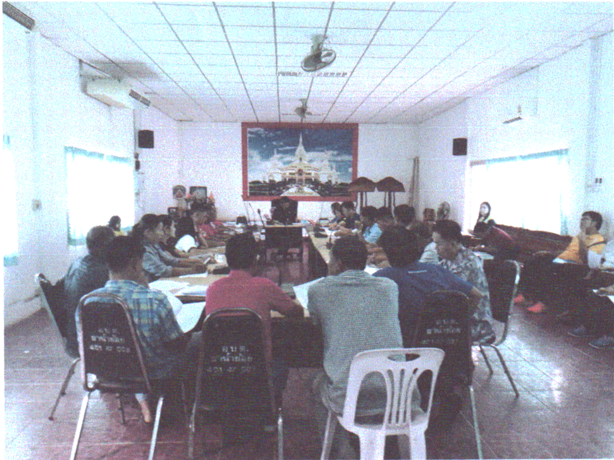
EB2(1) ภาพถ่ายกิจกรรมที่คณะทำงานฯ